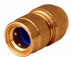
SCHLAUCHANSCHLUSS mit 6 Kugeln 1/2" ohne Wasserstop 1/2" mit Wasserstop 3/4" ohne Wasserstop 3/4" mit Wasserstop