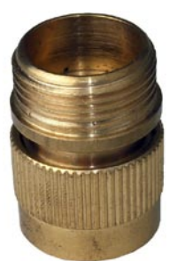
ANSCHLUSS 3/4" Innengewinde Außengewinde 3/4" ohne Wasserstop 3/4" mit Wasserstop