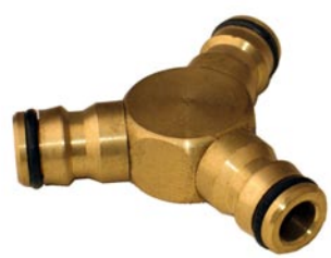
Y-VERTEILERSTÜCK 3 x Steckkupplung