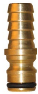
STECKKUPPLUNG x 1/2" Tülle