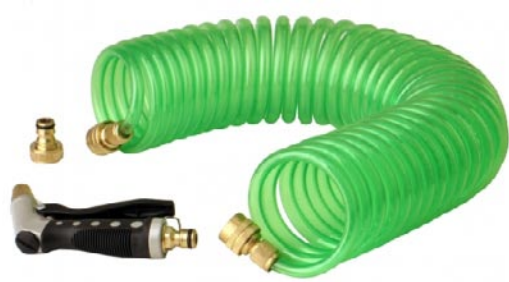
GARTENSPRITZE mit Flexschlauch